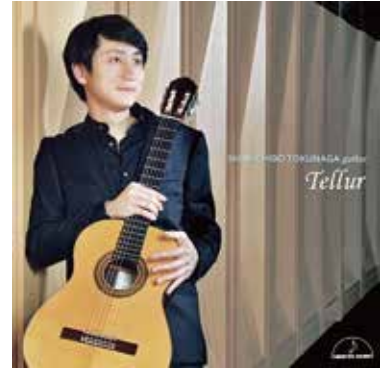
(マイスター・ミュージック)

R.S. デ・ラ・マーサ: サパテアード/ロンデーニャ E.S. デ・ラ・マーサ: 暁の鐘 A. ホセ: ソナタ R. ディアンス: サウダージ 第2番 T. ミュライコ: テリュール などを収録