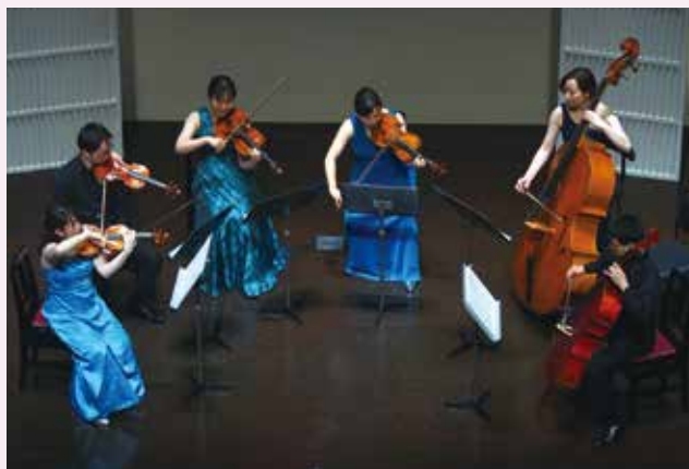
↑ 2023年5月28日 アンサンブル・リナーテ Vol.2 公演

2021年、「名フィルの日」室内楽演奏会をきっかけに結成。名古屋フィルハーモニー交響楽団のメンバー6人によるアンサンブルで、従来の弦楽六重奏におけるセカンド・チェロのパートをコントラバスに置き換えることで、より深みと広がりのあるサウンドを生み出している。あまり知られていない作品にも積極的に取り組み、その魅力を発信し続けている。2022年・2023年には宗次ホールにてコンサートを開催し、いずれも高い評価を得た。