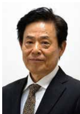
語り:竹元 真一郎 たけもと しんいちろう (ことばの会えくせるしあ)