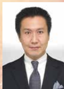
バリトン 初鹿野 剛