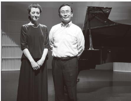
第3回・第4回(2019年10月26日)終演後