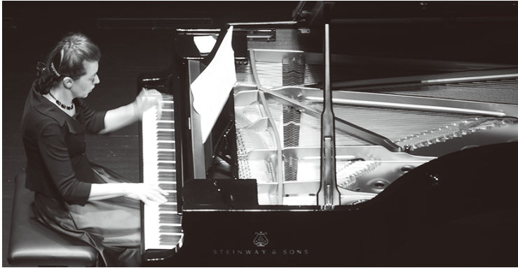
第1回・第2回(2019年4月27日)の演奏時