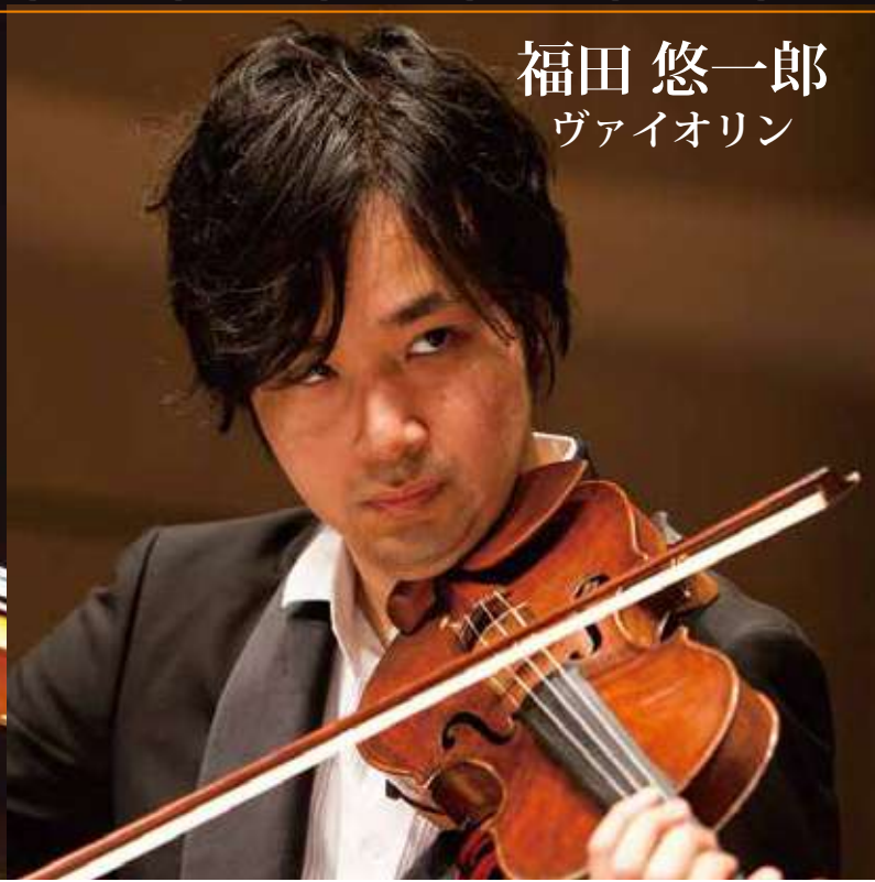
福田 悠一郎 ヴァイオリン