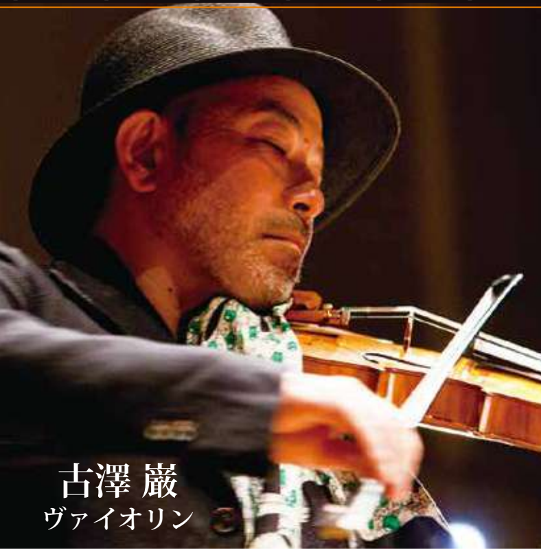
古澤 巖 ヴァイオリン