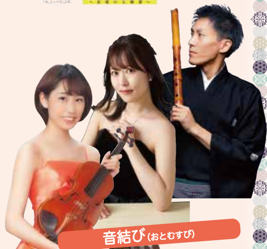
音結び (おとむすび)