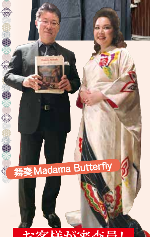
舞奏 Madama Butterfly