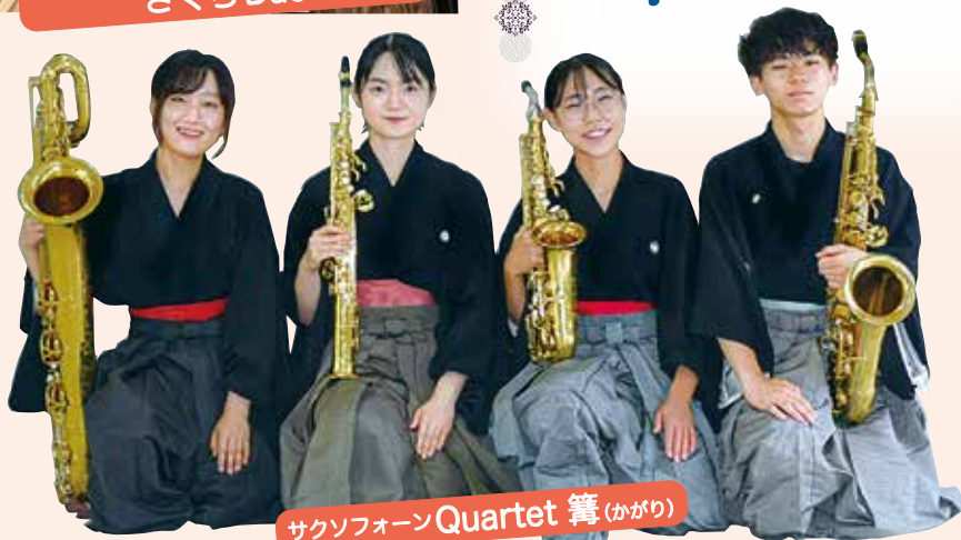
サクソフォン Quartet 篝 (かがり)