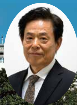
語り:竹元 真一郎 ことばの会えくせるしあ