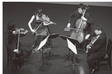
2019年2月17日 第5回公演 弦楽四重奏 第13番 Op.130演奏

愛知県岡崎市生まれ。東京藝術大学を経て、パリ国立高等音楽院、およびスイス・ベルン芸術大学ソリスト・ディプロマコースを首席で卒業。ルトスワフスキ国際チェロ・コンクール(ポーランド)第1位など、受賞多数。2016年、バッハ「無伴奏チェロ組曲全曲」をCD発売。レコード芸術誌で特選盤となる。紀尾井ホール室内管弦楽団メンバー。東京藝術大学准教授。使用楽器はNPO法人イエロー・エンジェルより貸与の1700年製ヨーゼフ・ゲアルネリ。