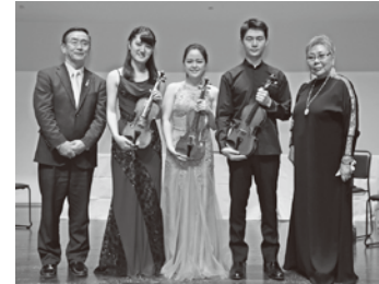
第6回宗次エンジェルヴァイオリンコンクール↑