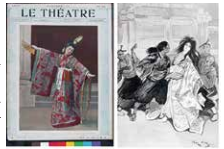
ヨーロッパでの公演風景記事