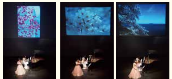
↑写真deクラシック第3弾

2015年3月20日開催、スイーツタイムコンサート「さくらの花びらコンサート」の様子。数多く応募された作品の中から、ステージ上部のスクリーンへ映写されました。この日のテーマは「桜」。遠景、近景、様々な角度から撮られた写真が集まりました。