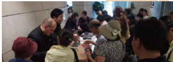
↑2017年9月5日スイーツタイムコンサート終演後のサイン会

16歳で単身アルゼンチンに渡り、本場のタンゴを学んだバンドネオン奏者と アルゼンチンを始め世界的に活躍するギタリストのアツイ競演！