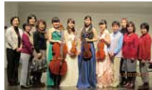
↑ 終演後、ステージでのワンショット!!