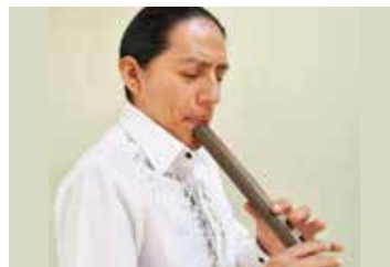
マルコ ケーナ&管楽器