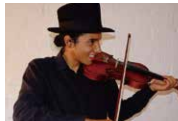
シモン ヴァイオリン&弦楽器