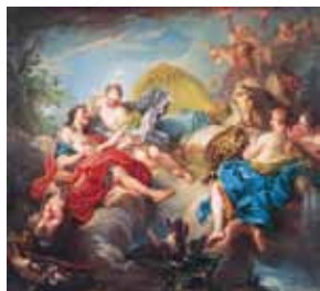
↑フランソワ・ブーシェ《アウロラとケファロス》 1745年頃 ヤマザキマザック美術館

一般1,300円 [10名様以上1100円] 小・中・高生600円 小学生未満無料 (音声ガイド無料サービス)