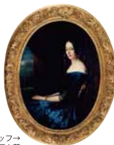
↑クロード＝マリー＝ポール・デュビュッフ→ 《アメリ・ビュネル》 1850年頃 個人蔵