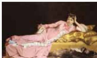
↑ジョルジュ・ルフェーヴル 《青いストッキングをはいた女流詩人》 1870年頃 長坂パロック株式会社