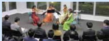
↑ Vol. 2 2016年12月7日開催

仕事を終えてからコンサートホールへ足を運ぶのはなかなか難しい...しかし、疲れた体に音楽で心の癒しが欲しい。