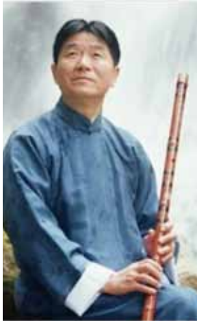
俞逊癸 (1946/1/8 - 2006/1/21) YU XUNFA

中国上海出身。13歳から人間国陸春齡に師事し、亡くなるまで中国民族音楽を代表する国家上海民族楽団の国家一级演奏家として活躍していた。その高度な技術と作曲の才能で「中国笛の王」と称され、しかし61歳の若さで亡くなり、生きている間に17種類の笛の演奏技法を開発し、数々の笛の名作を生み出した。今まで作曲した『汇流』、『琅琊神韵』、『妆台秋思』、『牧歌』、『河岸吹笛人』、『台湾民谣』等の曲は国家級中国笛レベル試験の指定曲目として指定され、その素晴らしい演奏を収録された10数枚のアルバムや著作も世界中に出版された。彼は中国笛の開発と発展に大変大きく貢献し、その名は国内外に知られていた。